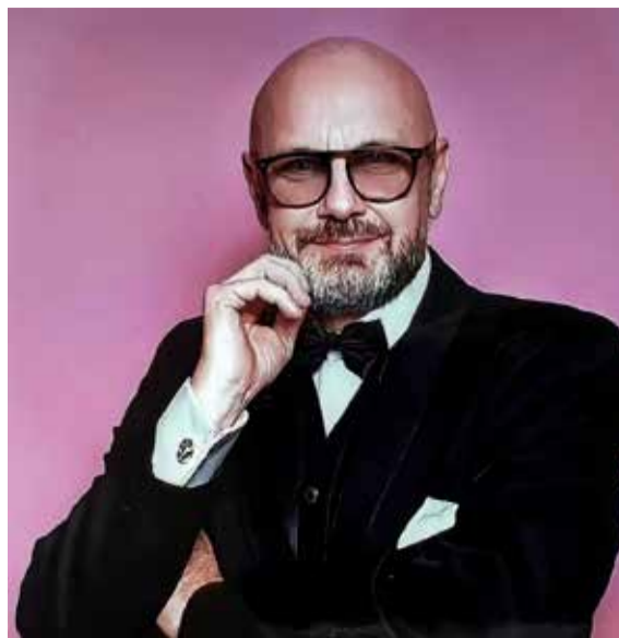
Krásné prožití nadcházejících svátků a hodně úspěchů do nového roku 2024 vám přeje

adventní čas se pomalu chýlí ke konci, blíží se Vánoce a Nový rok. Těšení na svátky můžeme vidět zejména v dětských očích, my, dospělí, máme naopak napilno, aby naši blízkým a přátelům nic nechybělo. Nakonec všechno zvládneme a rozhostí se mír a klid. Važme si toho, protože to neplatí ve všech zemích, ať už blízkých či vzdálených. U nás jsme letos přestáli několik ekonomických otřesů, důležité je, že jsme z nich vyšli posílení a zdraví. Jménem vydavatelství EUROPEAN PRESS HOLDING, a. s. bych rád poděkoval za celoroční podporu a spolupráci všem partnerům, jmenovitě těm stálým a největším, mezi které patří Skupina Sev.en, ORLEN Unipetrol a Severočeská voda, ale i mnohým dalším, bez kterých by noviny vycházely a webové stránky se plnily jen těžko. Někteří klienti nám dali důvěru i při pořádání projektů pro veřejnost, jakými jsou Czech Fashion Week nebo Osobnost roku Ústeckého kraje. V těchto aktivitách budeme i nadále pokračovat a hodláme je ještě rozšířit. Děkuji i našim čtenářům, kteří mají naše noviny rádi, o čemž svědčí rychle vyprázdněné stojany. A tak, i když v životě není pro nikoho každý den růžový, mějte na paměti to, co už věděli naši předkové, že s úsměvem jde všechno líp.