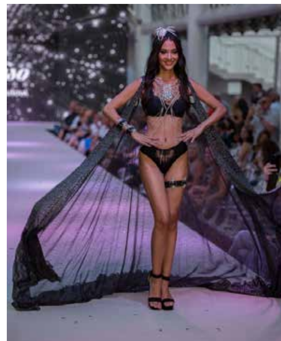
Luxusní spodní prádlo pochází z atelieru Jiřiny Matoušové.

Week o hlavní město Prahu a Mariánské lázně. Přípravy velkolepé akce vyžadují spoustu času a proto s nimi začal už v těchto dnech. Příznivci módních trendů a skvělé zábavy se mají na co těšit už teď. Výjimečnost a jedi-