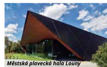
Městská plavecká hala Louny

ši 30 000Kč od generálního partnera akce, společnosti Holcim Česko. Letos se do soutěže přihlásilo 15 staveb postavených na území Ústecké-