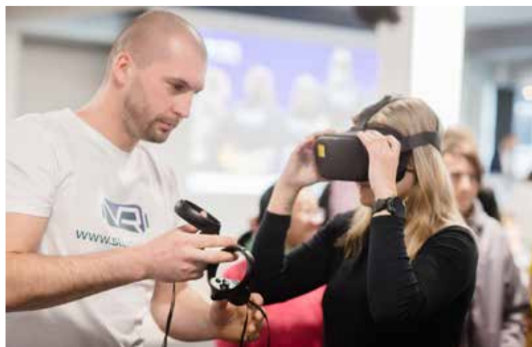
Bohatý byl i doprovodný program - návštěvníci si mohli vyzkoušet virtuální realitu...