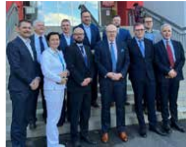
Na snímku je ministr zdravotnictví ČR Vlastimil Válek společně s vedením KZ, a.s.

„Dnešní návštěva nemocnic Ústeckého kraje obsahovala vše, co jsem chtěl. Jednání s kompetentním vedením o jeho vizi vedení zdravotnictví v kraji, diskuze s lékaři i pacienty, prohlídka fungování nemocnic a řešení čerpání evropských prostředků na modernizace péče i přístrojového vybavení. To vše proběhlo a já odjíždím spokojen,“ zakončil návštěvu ministr zdravotnictví Vlastimil Válek. Zdroj: www.kzcr.eu