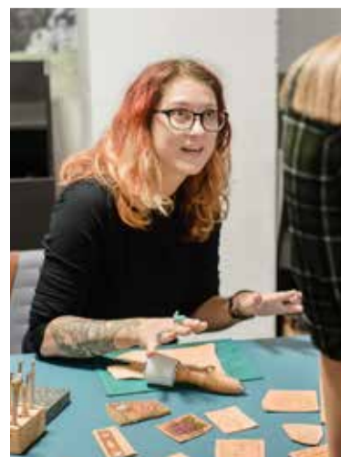
...ale i kreativní tvorbu.