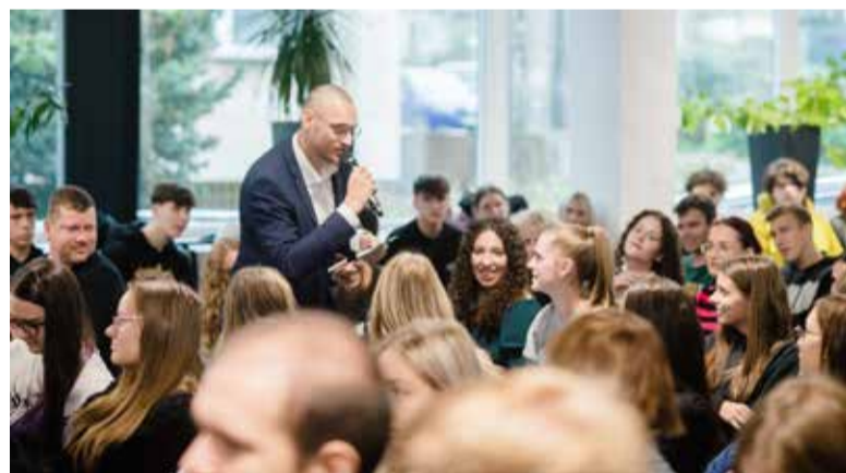
Studenti si vyslechli příběhy zdarů i nezdarů úspěšných podnikatelů a měli pochopitelně zvědavé dotazy.

V říjnu už po osmé pořádalo Inovační centrum Ústeckého kraje svůj festival startupů Festup. Jedinečná událost v regionu přibližuje úspěšné podnikatelské příběhy, vzdělává v byznysových dovednostech, pomáhá konzultacemi začínajícím i zavedeným podnikatelům a prezentuje inovativní podnikání. Letos přilákala více než 300 studentů středních i vysokých škol, zájemců o podnikání i začínajících firem.