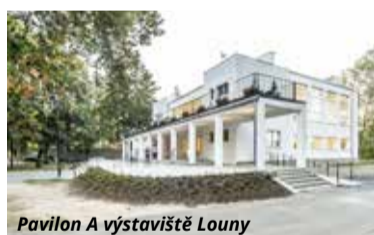
Pavilon A výstaviště Louny

A výstaviště. Stříbrnou příčku obsadil hrad Litoměřice, který před lety prošel velkou rekonstrukcí a nyní slouží jako konferenční centrum a expozice českého vinařství. I třetí místo patří městu Louny za budovu městské