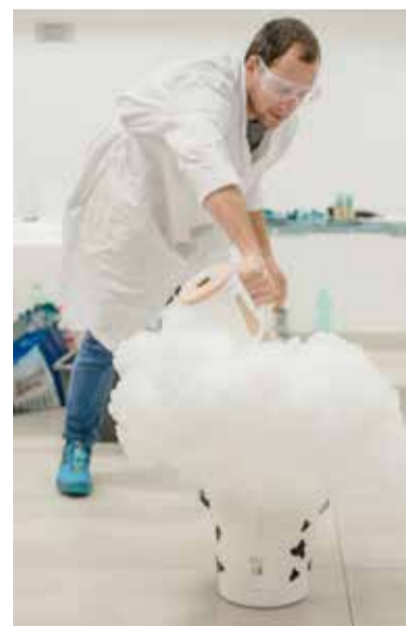
Přírodovědecká fakulta UJEP připravila i zajímavé pokusy.

Festival startupů Festup probíhal v prvních ročních na univerzitě, poslední dva ročníky jej už Inovační centrum Ústeckého kraje pořádá v prostorách svého sídla ve Velké Hradební, kde má k dispozici velký i menší eventový sál a další zasedací místnosti. Využívá ale i prostory foyer, přilehlé kavárny Space Café&Bar i nejbližší okolí.